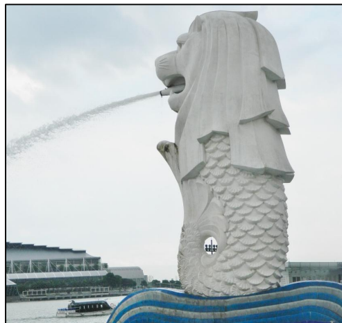
Gambar 1 Patung Singapoera di perumahan mewah Surabaya (atas) sebagai simbol globalisasi. Singapura sebagai acuannya (foto aslinya di bawah)