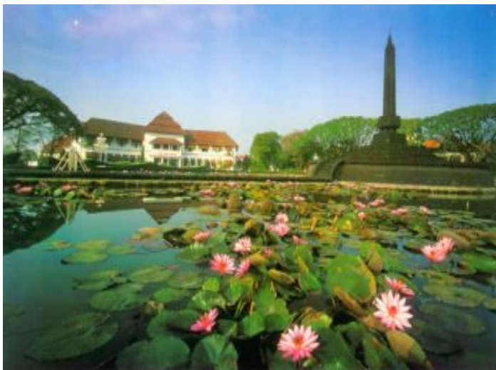
Gambar 3 Balai Kota Malang dengan Tugu di depannya.

indah. Gambaran Balai Kota Malang meniru kota-kota di Eropa, khususnya Belanda dengan taman dan air mancur di depannya.