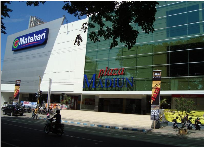
Gambar 7 Salah satu Plaza di Kota Madiun. Megah, meninggalkan tradisionalisme Jawa

negeri, melainkan juga untuk tujuan ekspor ke Malaysia dan Thailand. Kapasitas produksi per tahun menghasilkan di antaranya 300 gerbong barang, 60 kereta penumpang, 40 KRD dan KRL.