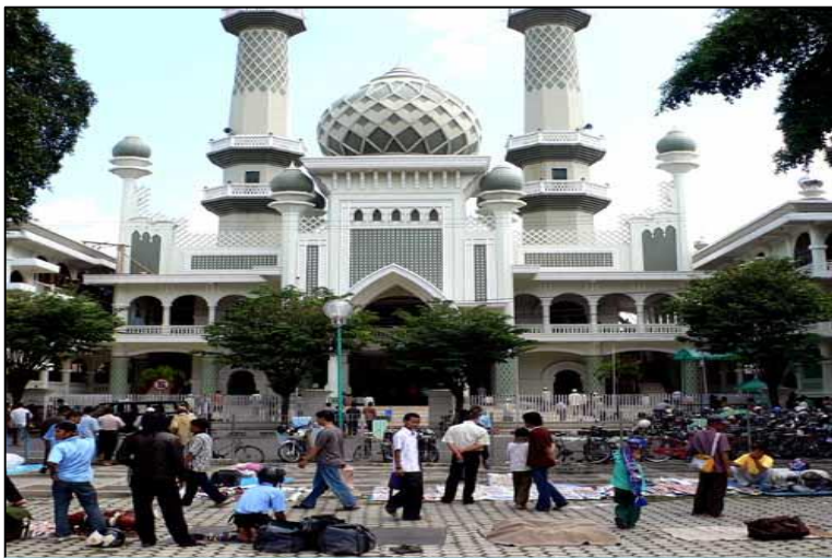
Gambar 5 Masjid Jami' Malang

Aspek Sosial-Budaya. Dari sisi budaya, Malang memiliki tiga sub-kultur, yaitu sub-kultur budaya Jawa Tengahan yang hidup di lereng gunung Kawi, sub-kultur Madura di lereng gunung Arjuna, dan sub-kultur Tengger sisa budaya Majapahit di lereng gunung Bromo-Semeru. Budaya asli Malang ini kemudian bergabung menjadi satu dengan berbagai budaya dan tradisi yang dibawa oleh masyarakat pendatang. Sebagaimana kondisi kota-kota besar di Indonesia, Malang kemudian berkembang sebagai kota pertemuan berbagai budaya, tradisi dan adat istiadat.